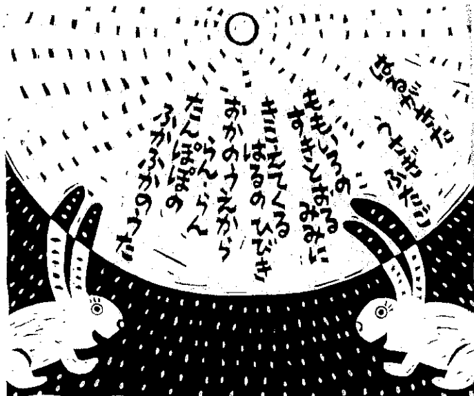
くどうなおこ 「のはらうた」より